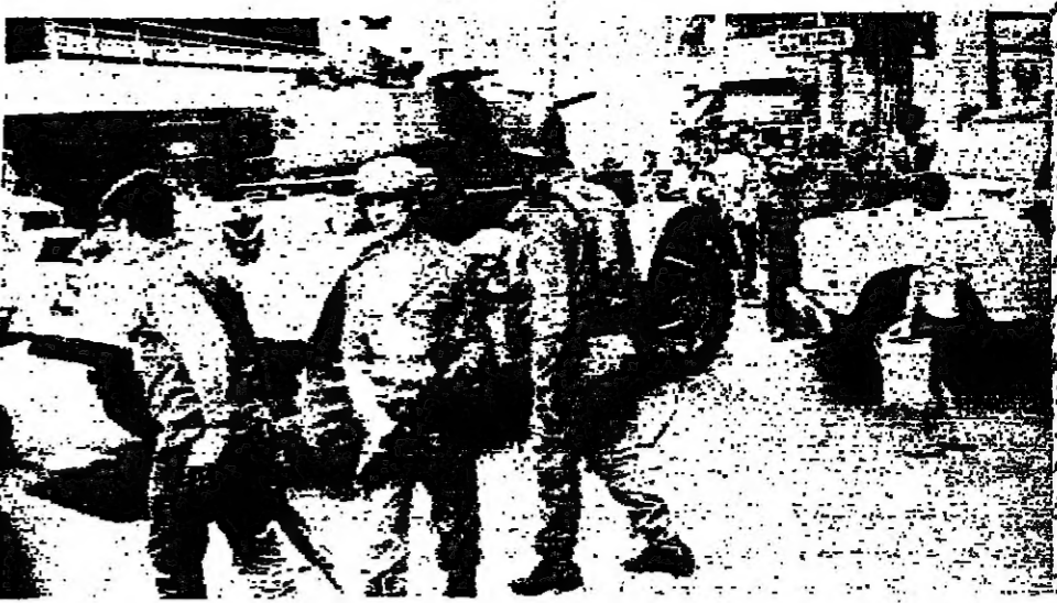
بعض رجال السن الموزين بصنعة اتاه الماده